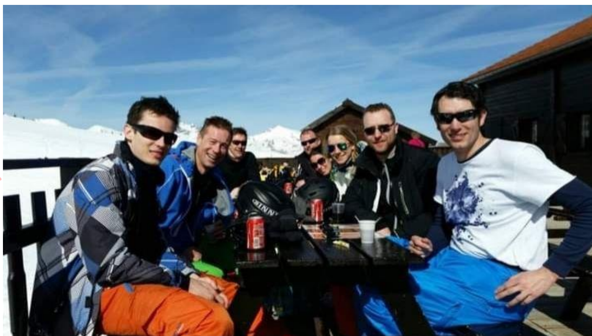
Groepsfoto DES skiweekend 2015