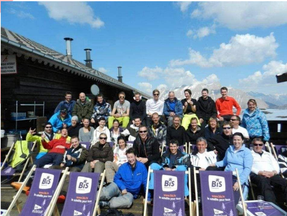
Groepsfoto DES skiweekend in 2013

Alweer veel te lang geleden, maar hopelijk (gaan we van uit) komend jaar weer mogelijk!