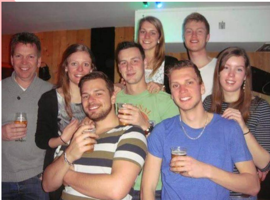
DES skiweekend 2014